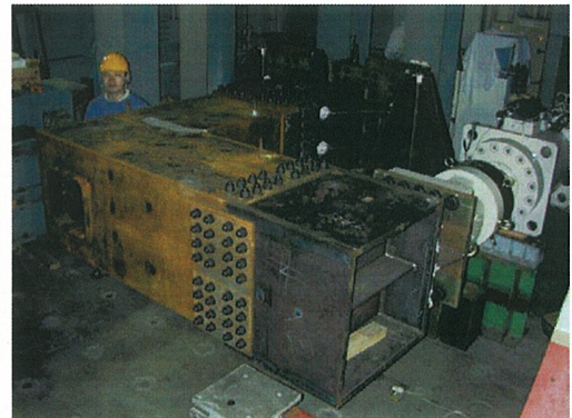
鋼製橋脚の大型疲労試験

都市内高架橋を支える鋼製橋脚に多くの疲労損傷が生じていることが, 最近の定期検査で明らかとなり, その補修・補強対策が火急の課題となっています。疲労き裂は, 地震時には脆性破壊の起点となり, 鋼製橋脚を倒壊に導く恐れのある危険な損傷と言えます。耐震面からもその対策が不可欠とされています。疲労損傷を受けた鋼製橋脚に対する効果的な補修・補強対策を開発するためには, まず原因究明をし, その原因に応じた対策を提案していくことが不可欠となります。この研究は, 対象橋梁の挙動特性や応力状態などの構造的な特徴, 溶接品質, 材料特性, 破壊力学など多面的な知識を活用した総合的な判断が求められる最先端の研究として, 世界的にも注目されています。